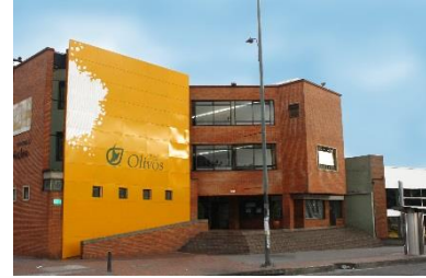
Calle 15 Sur No. 14-58