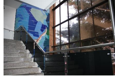
Calle 42 No. 14 - 20