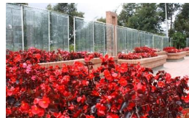
Kilómetro 1,7 vía Bogotá - Siberia