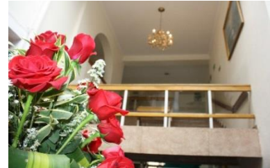
Carrera 18 No. 33 - 12